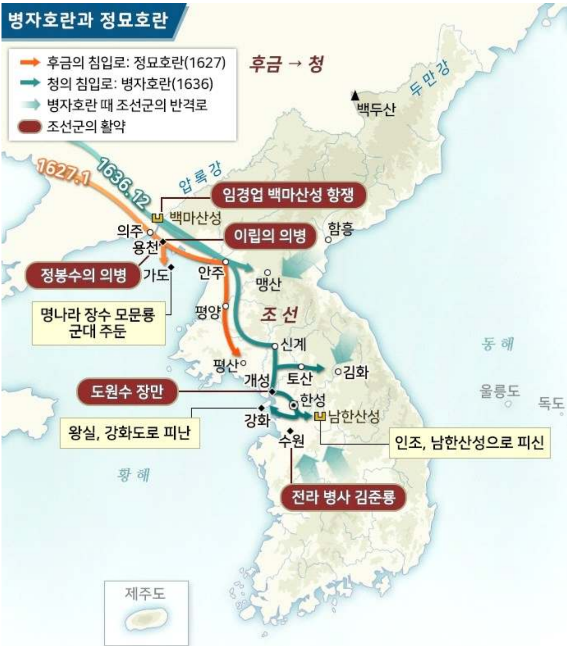
(그림 4) 병자호란과 정묘호란

여진족이 세웠던 금나라는 1234년 몽골에 의해 멸망한다. 금나라가 망한 후, 여진족은 부족 단위로 뿔뿔이 흩어져 살다가 16세기 후반, 명나라가 약해진 틈을 타서 세력을 키웠으며, 이때부터 만주족이라 부르기 시작한다. 만주족의 우두머리였던 누르하치는 부족들을 통합하여 후금을 세운다. 누르하치의 뒤를 이은 홍타이지는 1936년 나라 이름을 청으로 바꾸고, 농민 반란으로 명나라가 멸망한 틈을 타서 중국 전체를 지배하기에 이른다. 홍타이지는 내몽골을 평정한 후, 조선을 침략해 호란을 일으킨다.