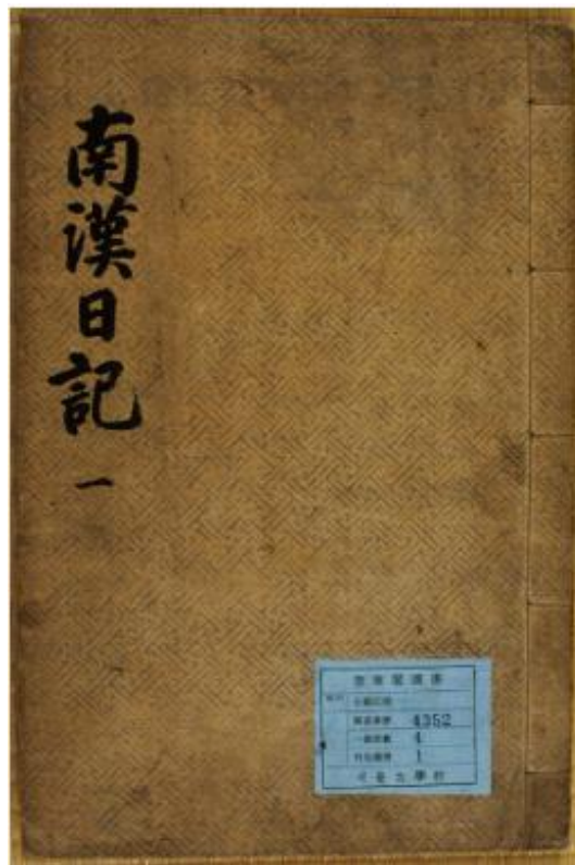
(그림 2)

《남한일기》는 1636년 청나라가 조선을 침략하여 남한산성에 위협을 가하던 시기로부터 시작하여 45일 간의 방어사실과 피침상황(被侵狀況) 등을 서술하였다. 《남한일기》는 알려져 있지 않다가 1753년(영조 29)에 당시 광주부유수(廣州府留守)인 이기진(李箕鎭, 1687~1755)이 발견하여 사료적 가치가 있음을 인정한 후, 등사하여 배포함으로써 세상에 널리 알려지게 되었다. 《남한일기》는 병자호란 때 저자 자신이 직접 남한산성에 들어가 전란방어책과 용전, 격퇴상황 등을 면밀히 기록한 글이다. 또한 청나라가 조선에 침입하였을 때의 청군의 군비상황과 부대배치, 적장의 인적사항 등을 담고 있어 병자호란의 전모를 이해하는 데 귀한 자료가 된다.